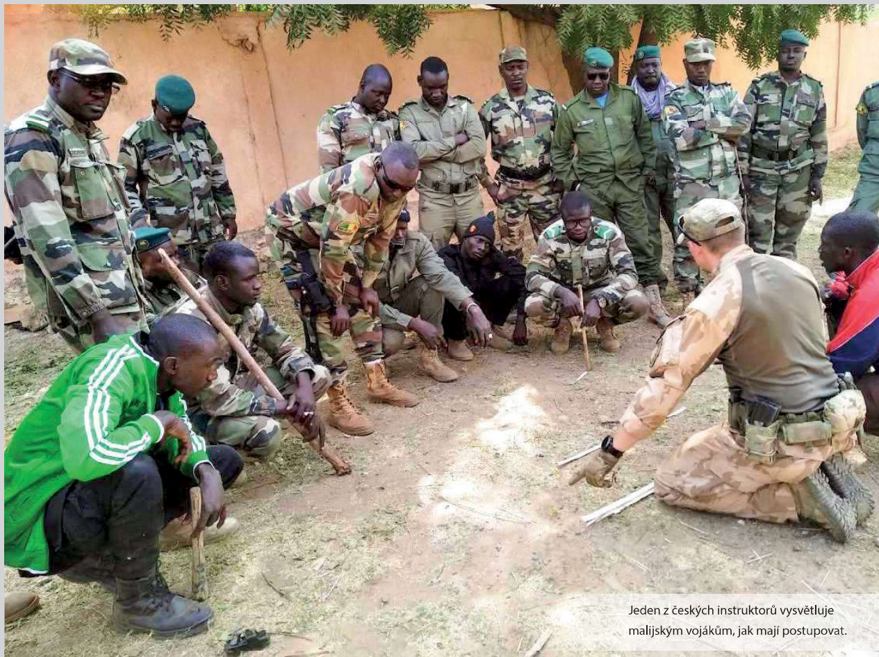
Jeden z českých instruktorů vysvětluje malijským vojákům, jak mají postupovat.